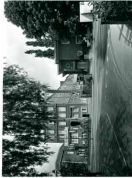
1965: De Ritmeester Sigarenfabriek