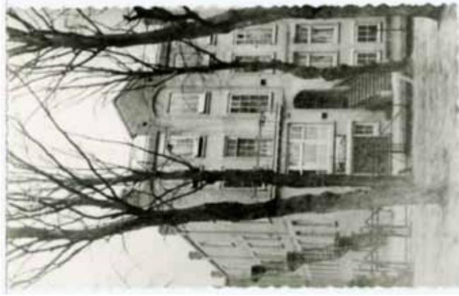
1916: Een gedeelte van de noordelijke zij- voorgevel van de Tabaks- en Sigarenfabriek "De Nijverheid", de latere Ritmeester Sigarenfabriek aan de Kerkewijk.